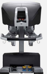
サージョンコンソール

従来の「腹腔鏡手術」の鉗子は長い棒状のため可動域が限定されますが、「ダヴィンチ」の鉗子は360度回転し関節もついているため、自在に動かすことができます。従来の「腹腔鏡手術」では高度な技術を要した手術操作が楽にできるようになりました。