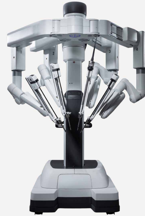
ベシエントカート