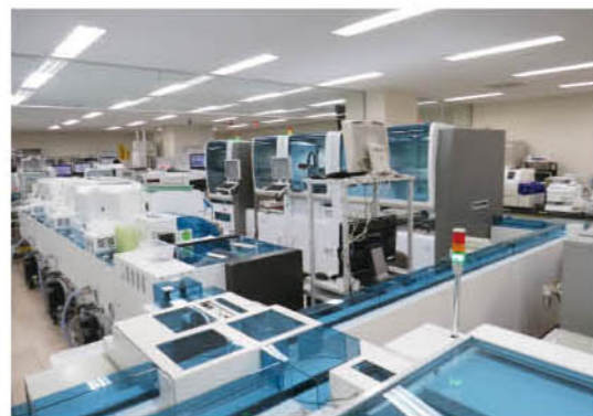
▲導入した分析装置