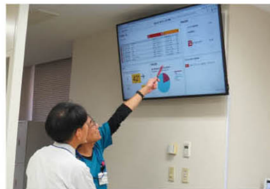
▲検体の進捗状況をシステムで一括管理

導入した装置は、より速い検査の順番を考え効率的に測定します。また大量の検体および、たくさんの項目を同時に分析するため、より迅速かつ効果的に検査を行うことが可能となりました。分析前の処理から血液や尿を検査する生化学測定、ウイルスやホルモンの値を検査する免疫検査システム、測定済み検体の収納までが一体型であるのは日本初。また、検査を止めないために、2台の分析装置を導入したことにより、より一層の検査時間の短縮につながっています。