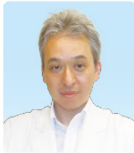
院長名 伊藤 裕也 /: 休診