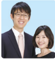
院長名 春日井 親俊 副院長名 春日井 一葉 /: 休診