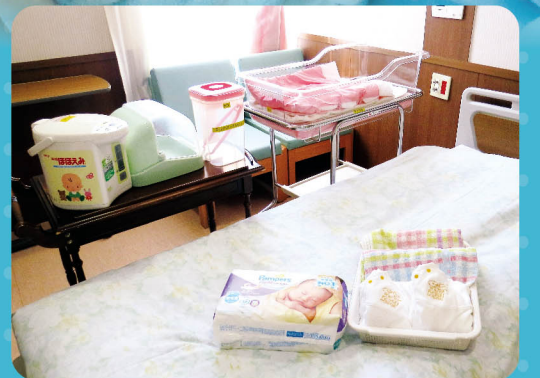
入院グッズは準備してあります